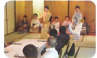
岐阜芸妓組合員による舞踊