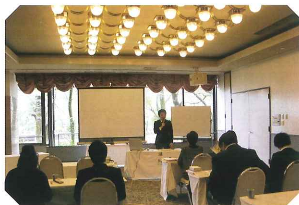
養成講習を受講中の新任相談員の方々

今年度も、新たに7名の方に委嘱されることとなり、昨年養成講習会を受講され、4月1日付けで岐阜県知事から委嘱状が交付されました。今後の皆さんのご活躍を期待します。