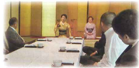
鳴り物「小鼓」の構造等の説明を拝聴

映像事業に携わる者として貴重な体験になったと思います。今後も映画協会は、県内映画館の支配人やスタッフに向けて、研修や視察を兼ねた事業を展開する予定です。