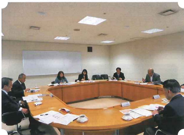
コールセンター事業連絡会議での協議

会議では、県民生活相談センターに寄せられた相談事例の内容について相談センターより紹介があり、「サービスの内容に関する苦情相談」が最も多く、最近では高齢者からの相談も増えていること、また、相談内容については、消費者（相談者）と事業者との間に、商品・サービスに対する「知識格差」がトラブルを生む大きな要因となっており、格差を埋め、お互いの妥協点を見出すことが大切、とのことでした。