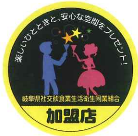
組合員用ワッペン

組合は、お客さまに「安全・安心」をお届けするため、今後とも事業を推進していきます。