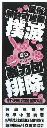
無許可営業、暴力団排除等のステッカー